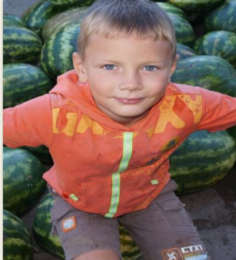
Мои любимые котята и гора арбузов