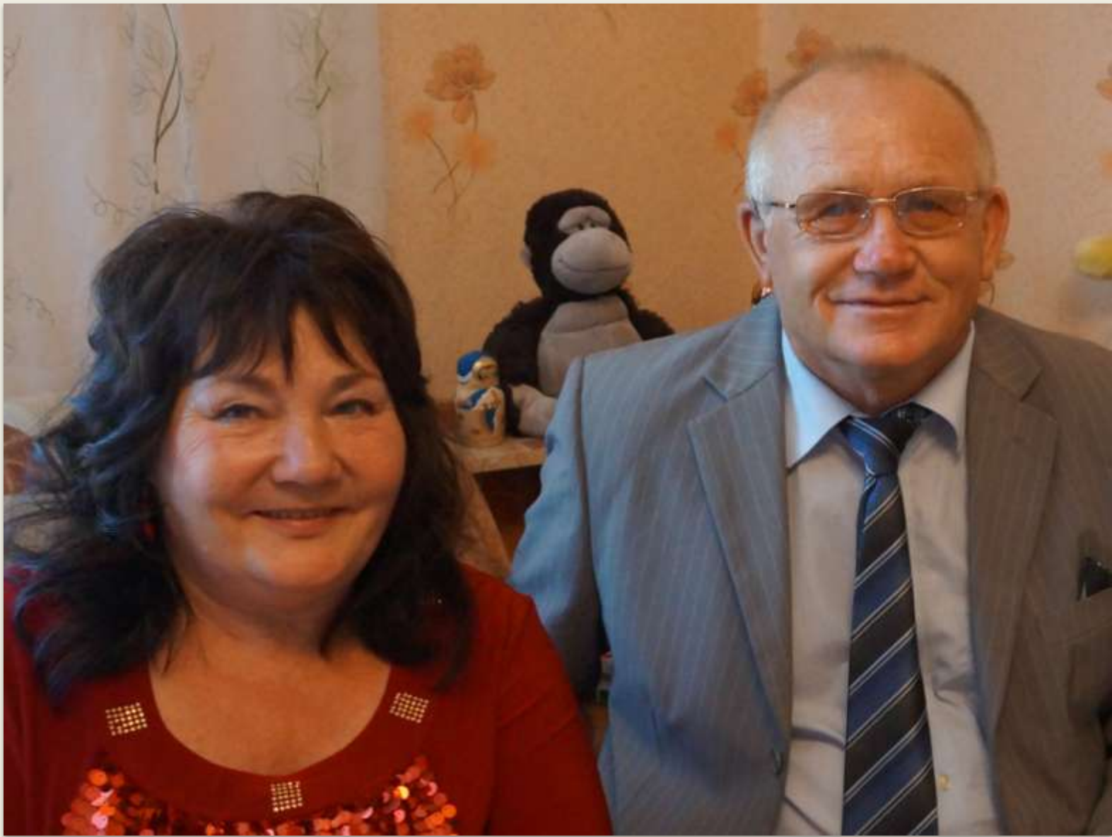
Это мои любимые дедушка и бабушка